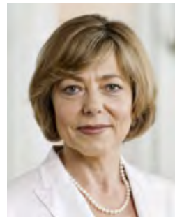
Die Stiftung steht unter der Schirmherrschaft der Frau an der Seite des Bundespräsidenten, Daniela Schadt.

„Hilf meiner Mama!“ Ihre Spende kommt an.